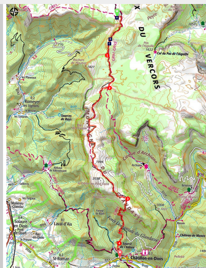
village de châtillon et montagne du glandasse

On quitte l'ambiance si particulière des Hauts-Plateaux avec ses grands espaces ouverts et sa nature sauvage, pour un retour tout en douceur vers la civilisation, à la découverte du village typique de Châtillon-en-Diois.