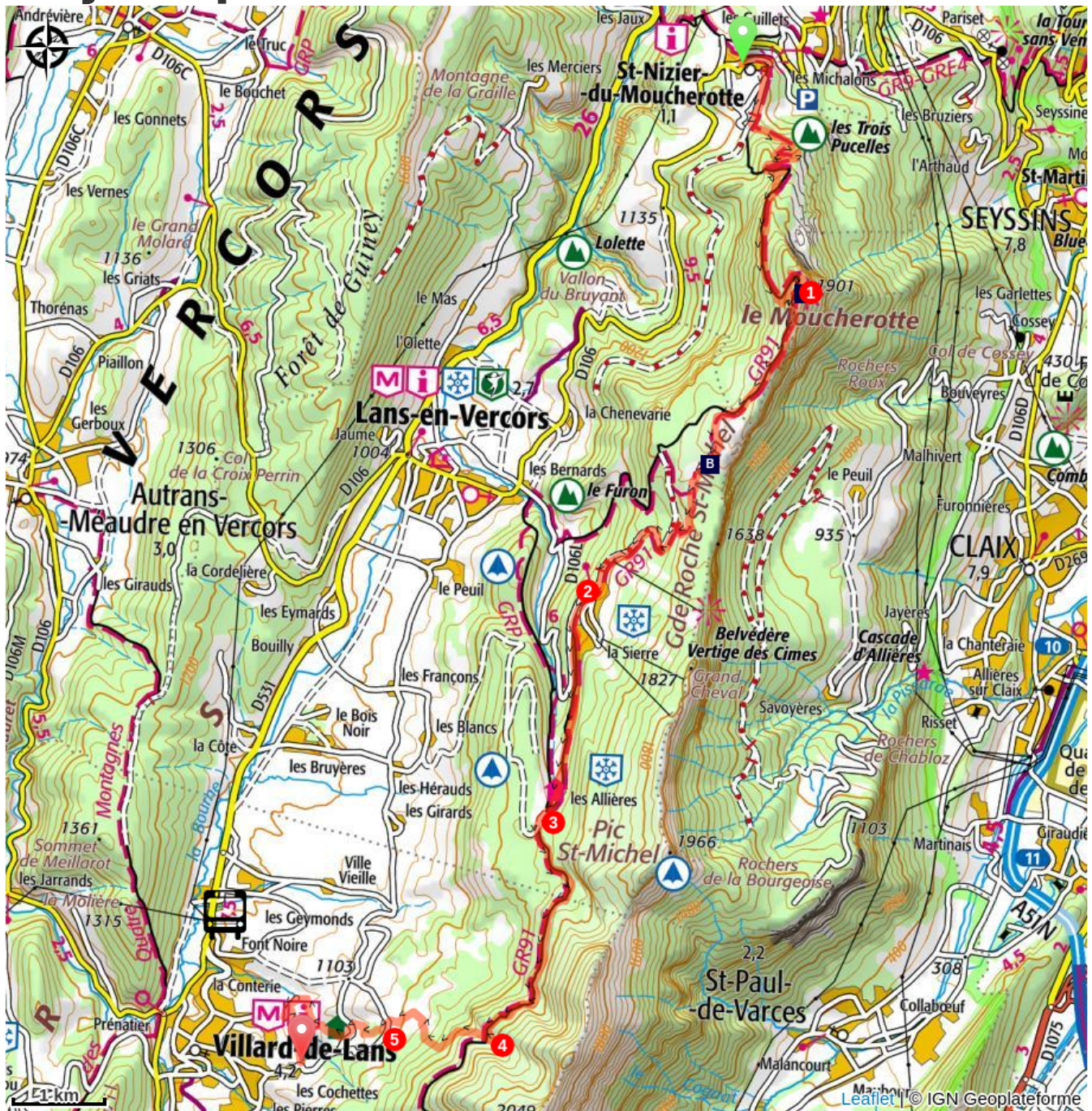
Summit of Moucherotte (A)