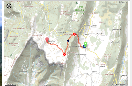
Crête des Gagères (ot_Vercors Drôme)