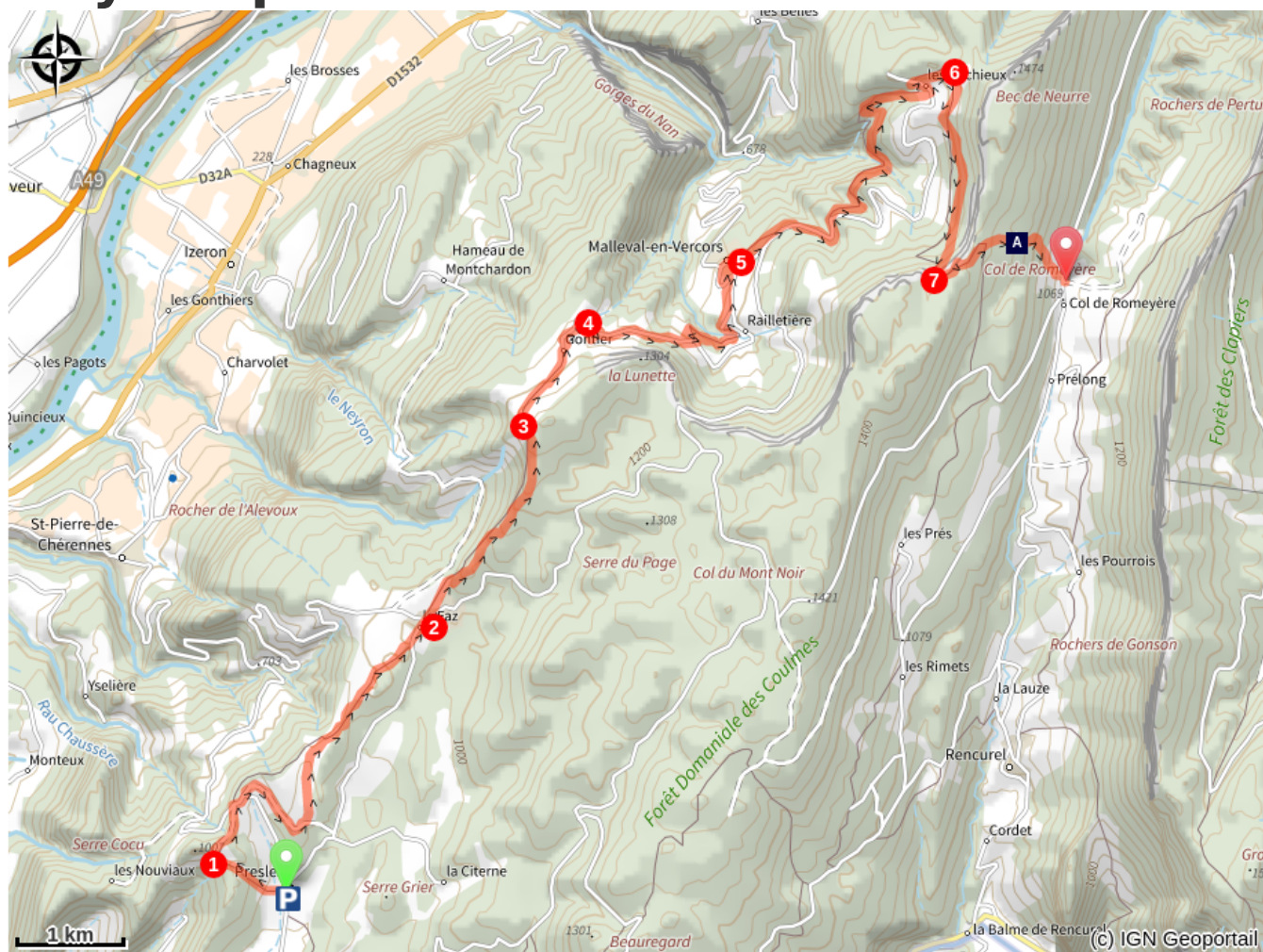
Vallon of Rencurel (A)