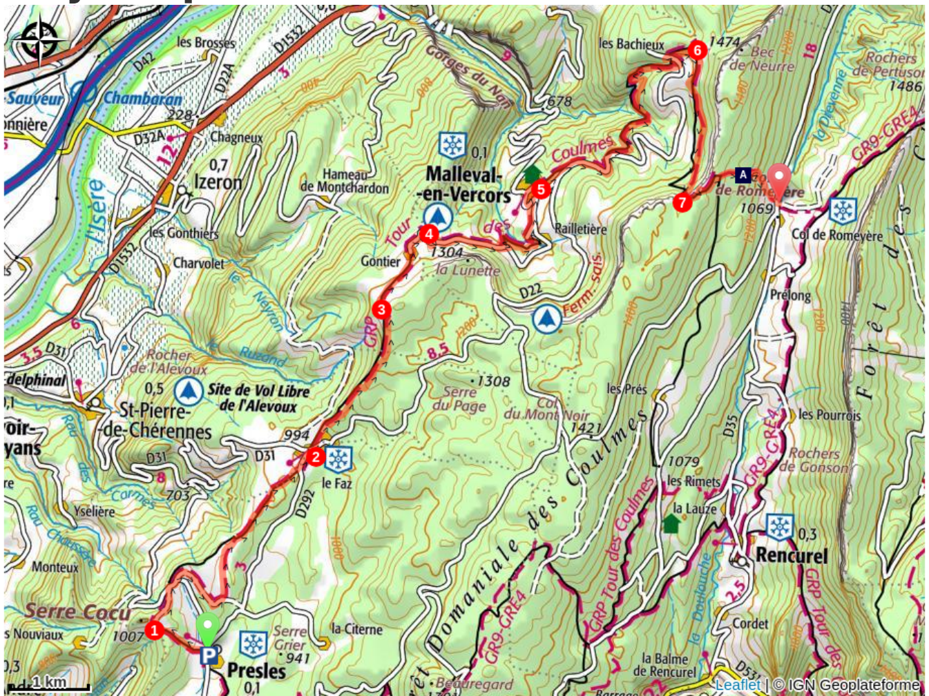
Vallon of Rencurel (A)