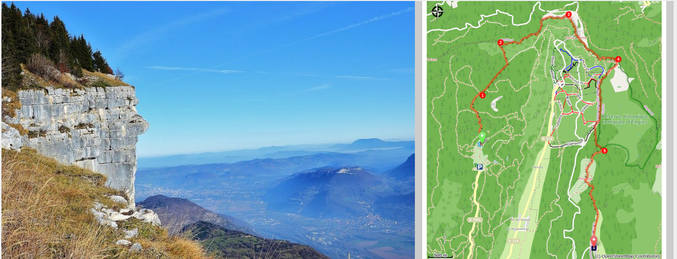
Vue sur la vallée grenobloise depuis La Sure (s_fayollat)