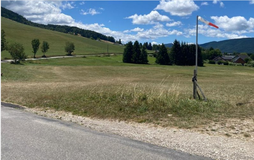
Atterrissage du site de l'Aigle (Noémie Castaing/PNRV)