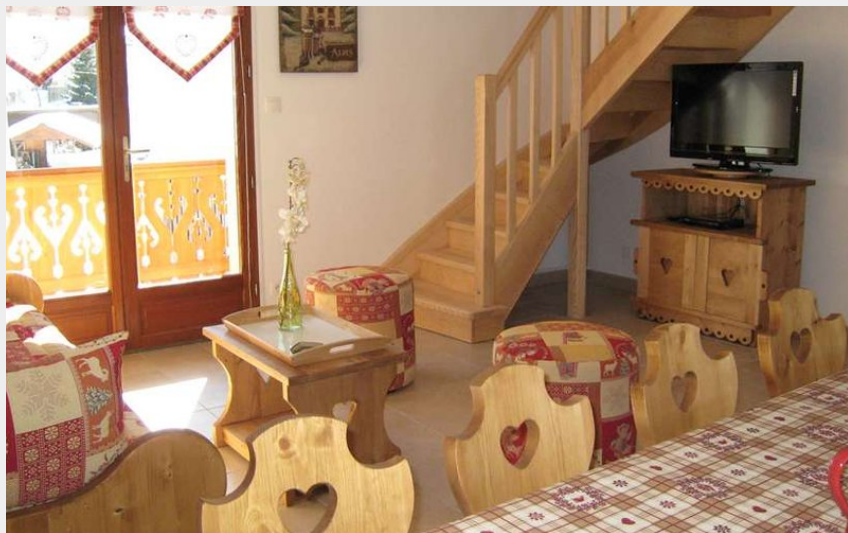
Crédit photo : Salon & escalier d'accès chambres duplex (Gîtes de France)