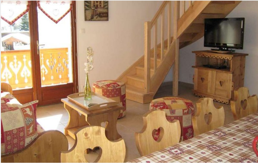
Crédit photo : Salon & escalier d'accès chambres duplex (Gîtes de France)