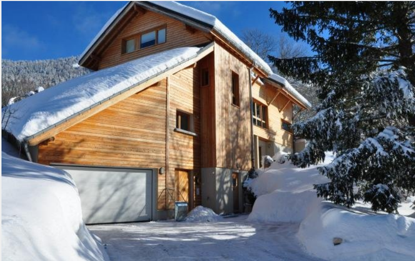
Crédit photo : parking de la maison (La maison d'hôte Agathe et Sophie)