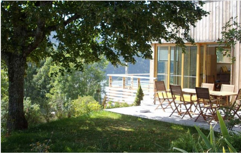
terrasse à l'ombre du tilleul, vue du jardin