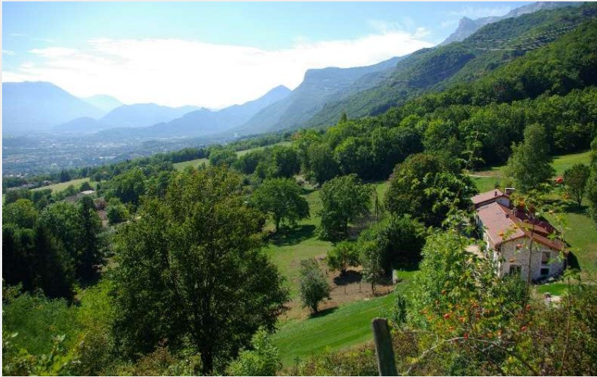
le Gîte dans son environnement privilégié