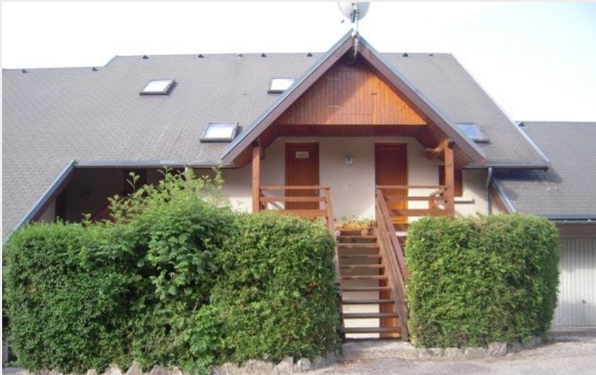
Vue de l'entrée porte de gauche 1er étage ( Nord )