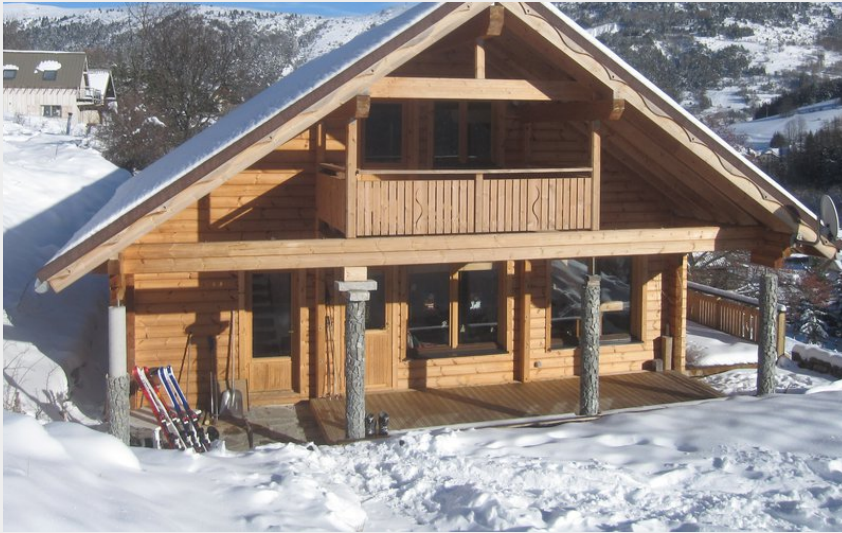
Crédit photo : Chalet Les Bouvreuils - Grresse-en-Vercors (Bernard MAGAUD)