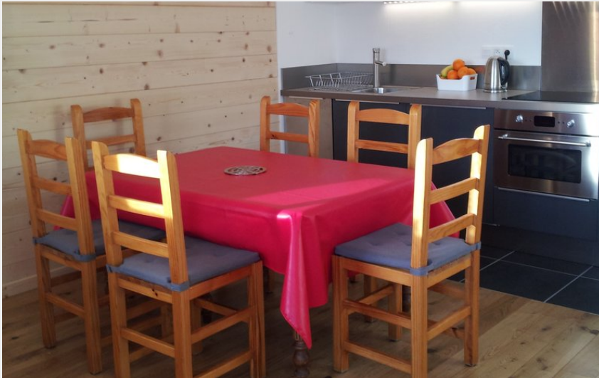
Crédit photo : Séjour (Agora Pasqualon - Appartement "Le P'tit Bois")