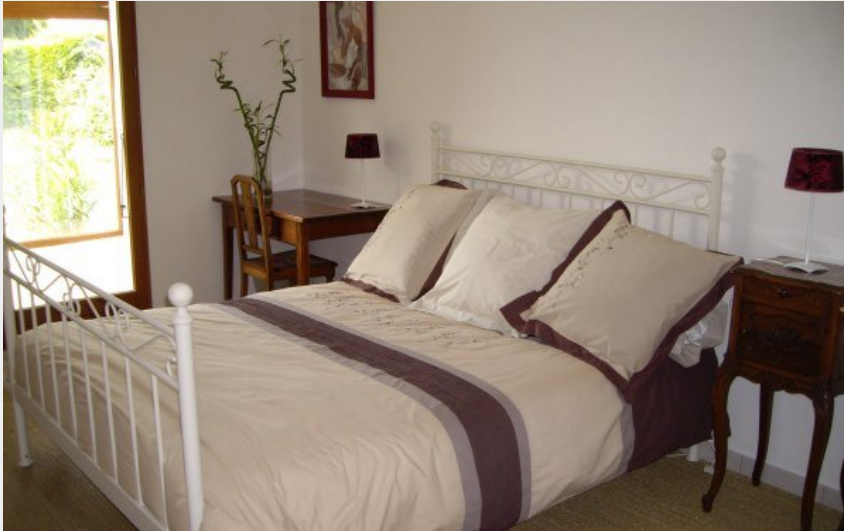
Crédit photo : Chambre d'hôtes au pied du Vercors avec spa extérieur à Claix en Isère (Clévances)