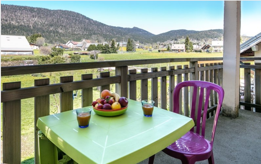
balcon côté jardin pour des petits déjeuners ensoleillés