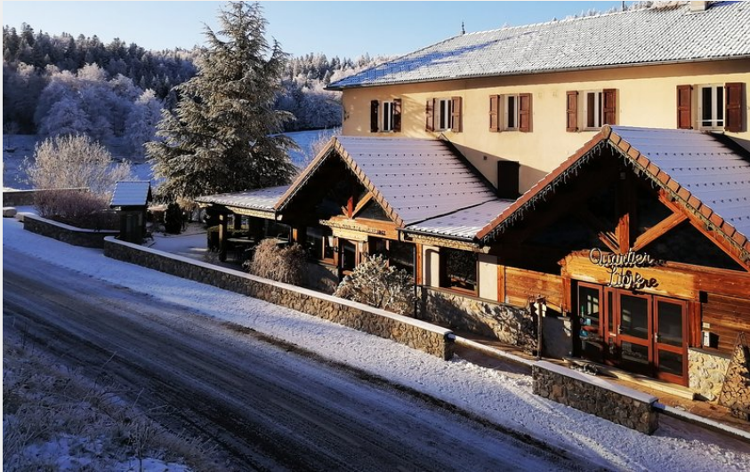
Devanture Hostel Quartier Libre-sous la neige