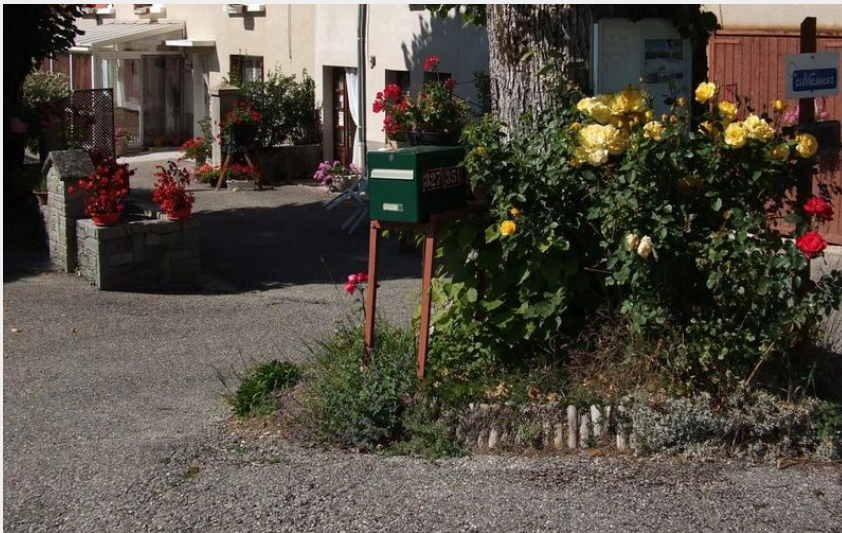
Chambre liseron pour 4 personnes à Lans en vercors