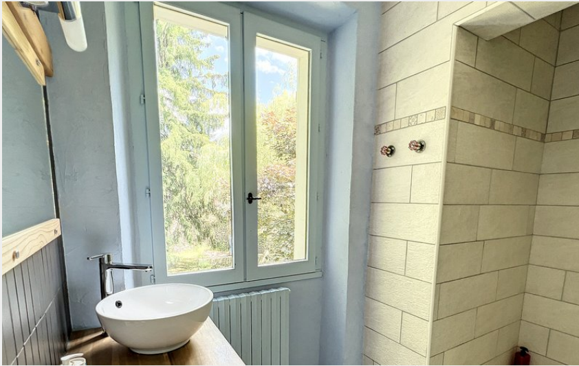
Crédit photo : Chambre "La Douce" et sa salle de bains privée (Isabelle GAUTHIER)