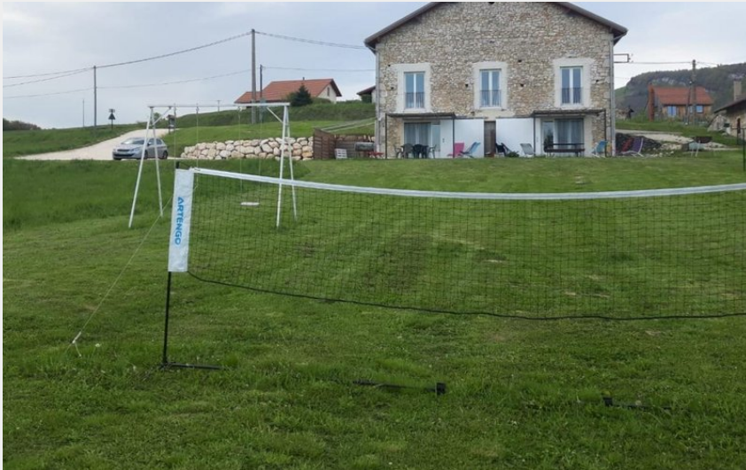
Filet de volley / badminton et balançoire