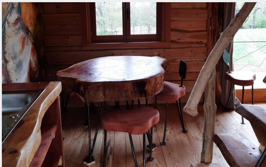
Crédit : intérieur cabane