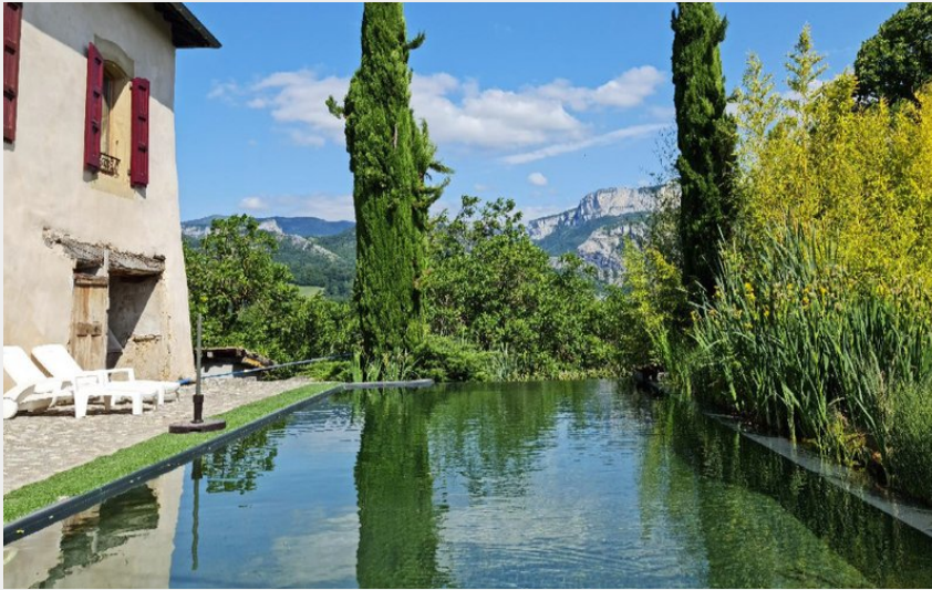
Crédit photo : Grand Maison, gîte respectueux de l'environnement face au Vercors