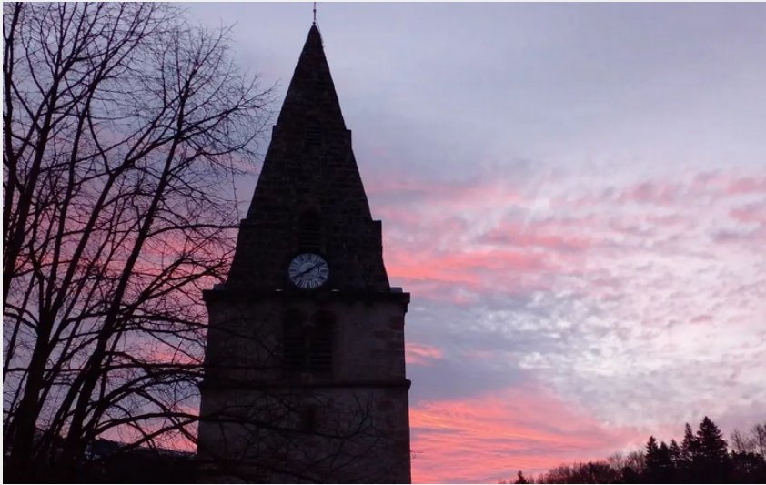
L'Eglise de Chichilianne en face