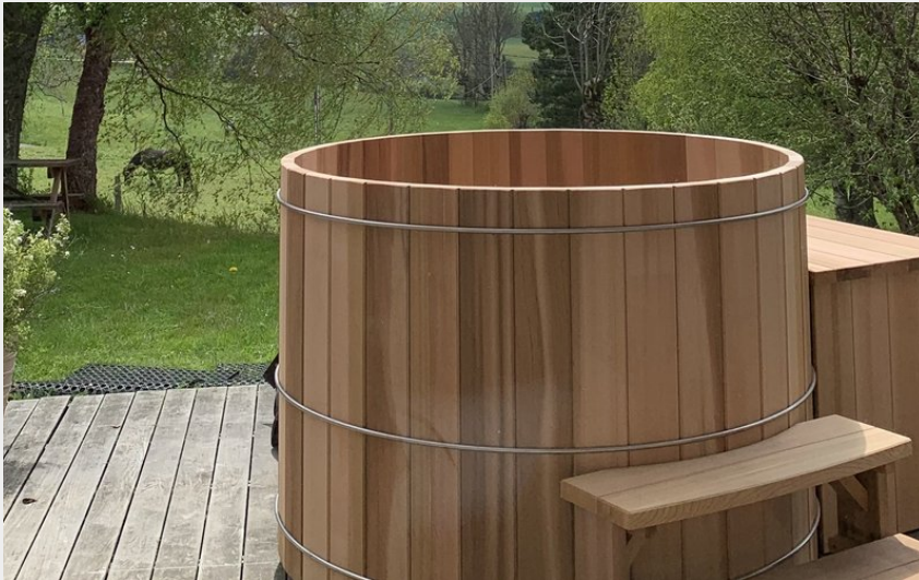
Crédit photo : Bain chaud d'été (La maison d'hôte Agathe et Sophie)