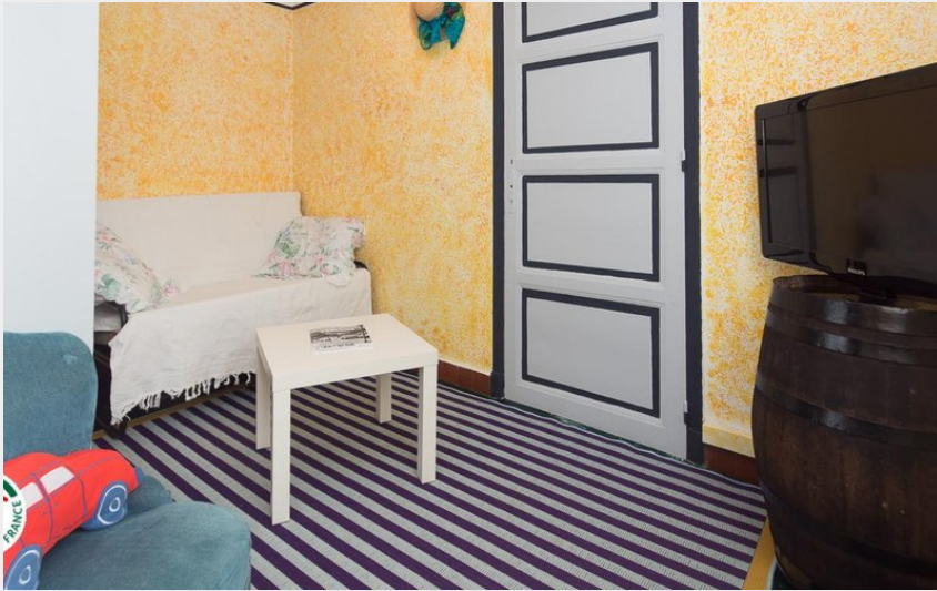
Nouveauté hiver 2023-2024 le petit salon TV (Gîtes de France)