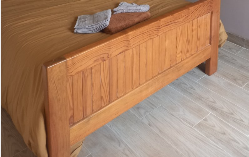
Crédit : La Chambre double du gîte la Maldina à Oriol en Royans (Clara Combernoux)