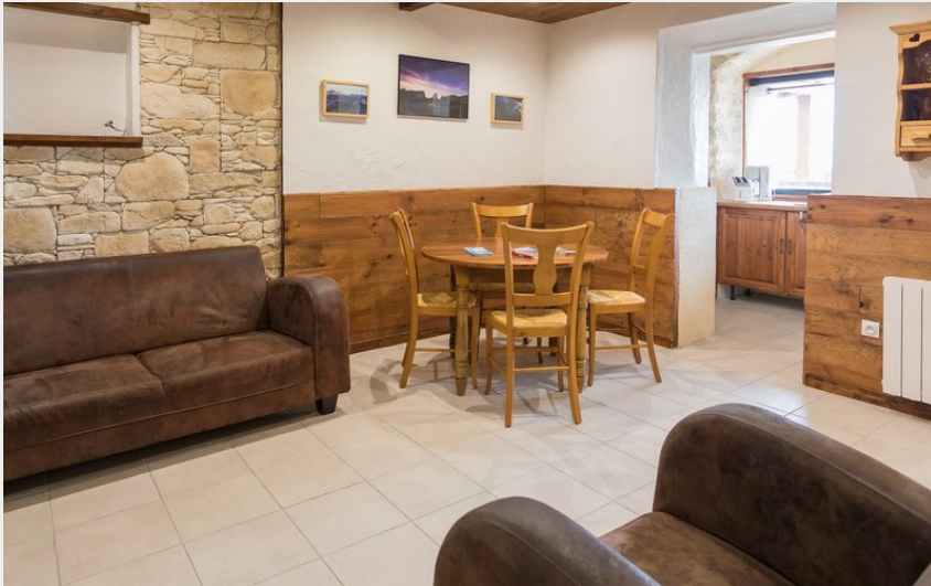
Salle de détente et repas dans le gîte