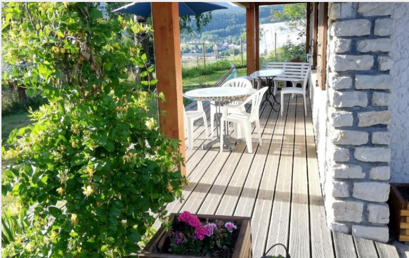
Crédit photo : Chalet des Mésanges pour 4 personnes à Autrans dans le massif du Vercors (Clévacances)