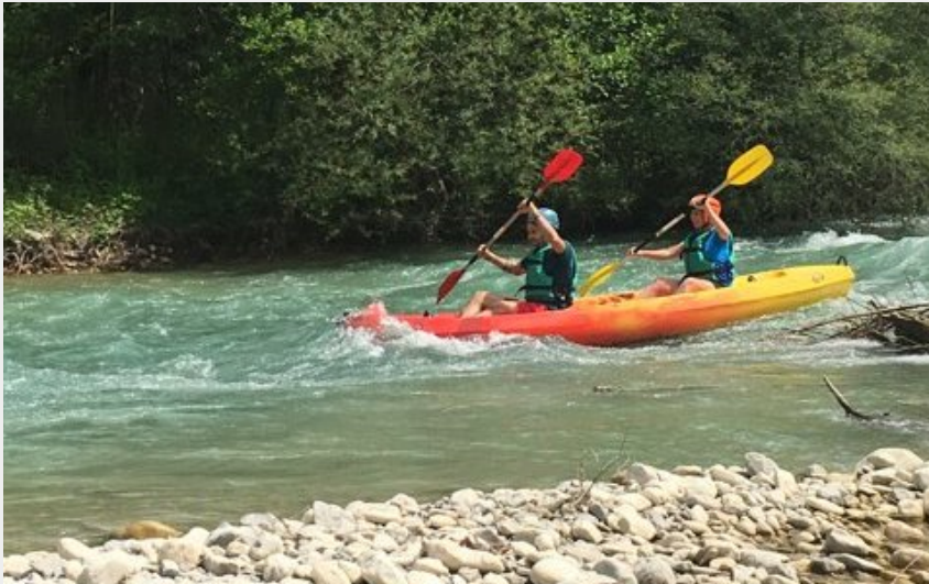
Crédit photo : PArcours Pont de quart Saint croix CA,océ kayak Drome (Drome aventure)