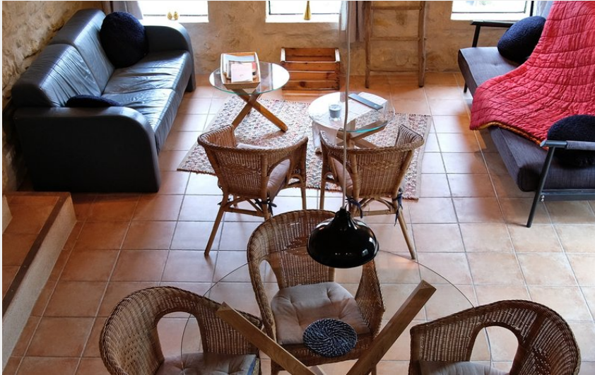
Crédit photo : Vue sur le séjour/le coin repas (Domaine de la Ruche Apis Mellifera)