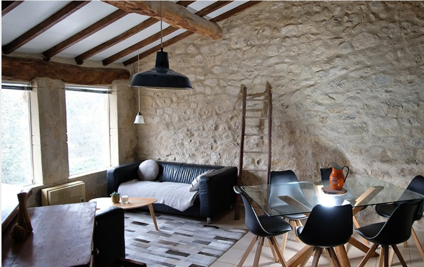
Crédit photo : Coin séjour/repas (Domaine de la Ruche Apis Carnica)