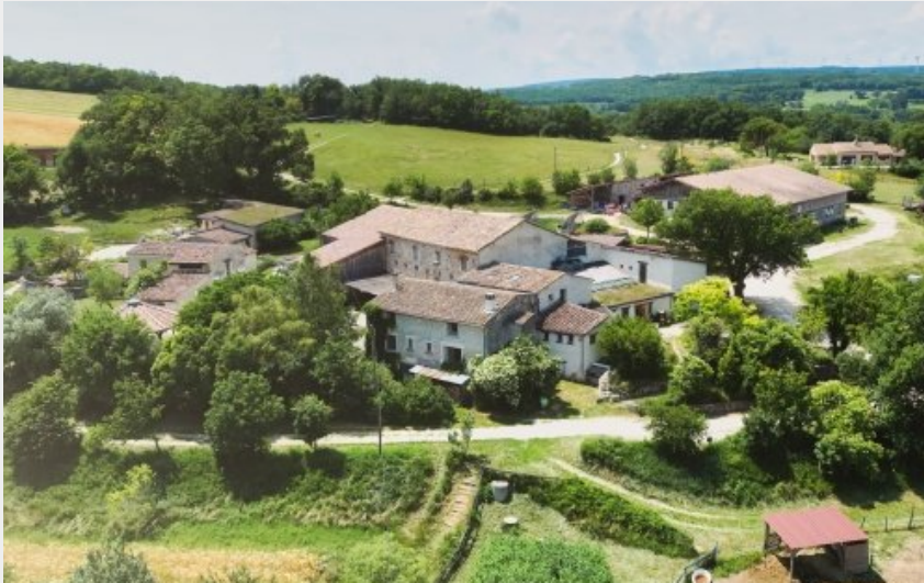
Crédit photo : Vue aérienne des Amanins (Kevin Simon - Les Amanins)