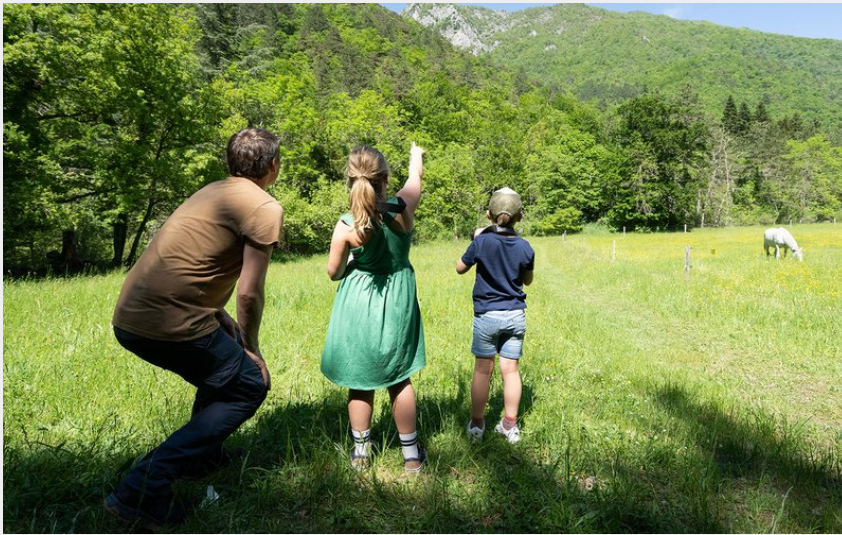
Crédit photo : Auberge des Dauphins - Exploration du synclinal (Auberge des Dauphins)