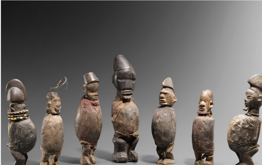
Crédit photo : Amulettes de protection (Musée spiritain des arts africains)