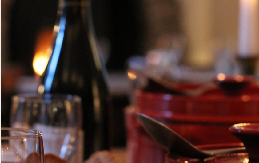
Crédit photo : Fontaine minérale - Pont de Barret (Fontaine minérale - Pont de Barret)