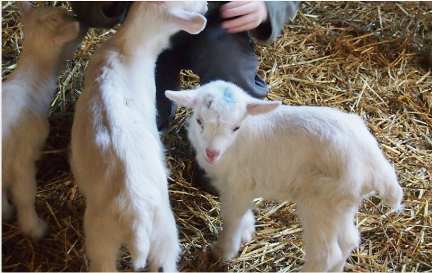
Crédit photo : Se ressourcer au contact des chèvres et autres compagnons ! (Angélique Doucet)