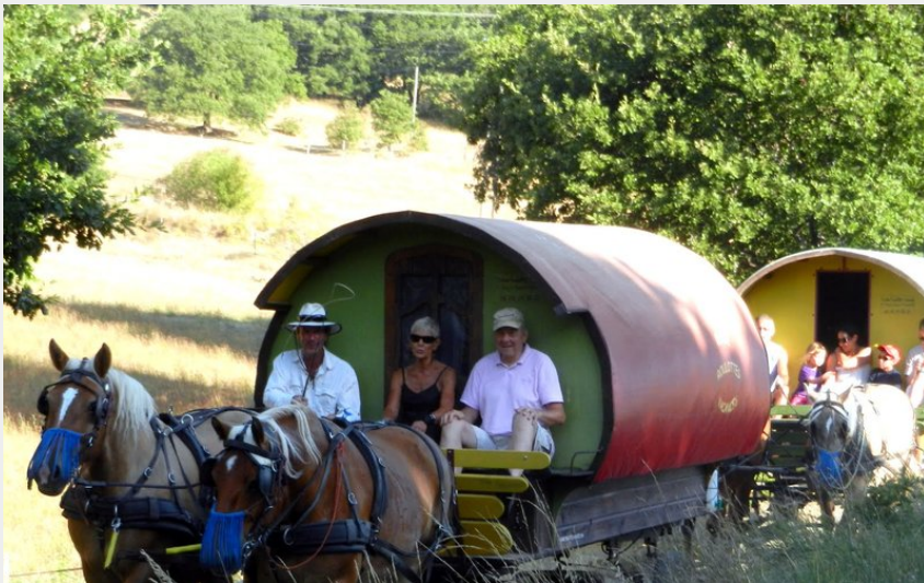
Crédit photo : partir à deux roulettes c'est possible (Odile Houël Olivier)