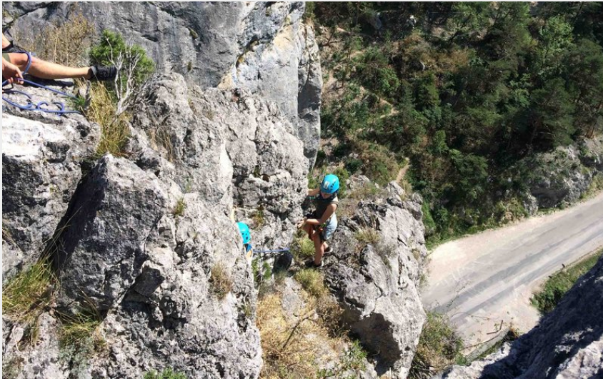
Crédit photo : parcours rochassiers et escalade Drome aventure (Drome aventure)