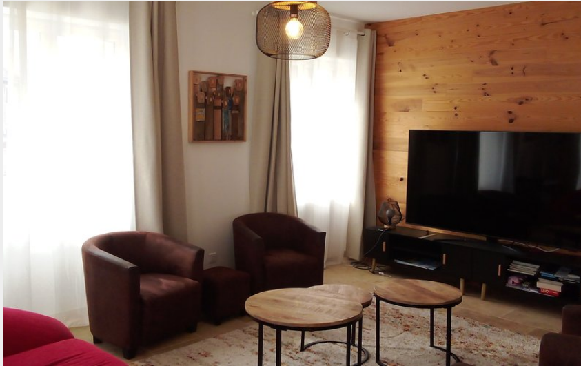
Crédit : Grand séjour lumineux avec canapé, fauteuil et écran plat. (B.Guironnet)