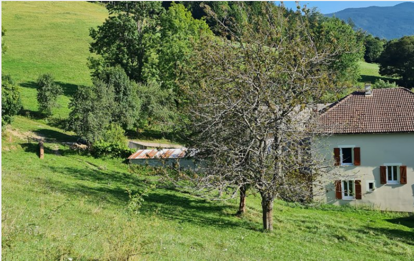
Vue du gîte de la Berthuinière entourée de prés