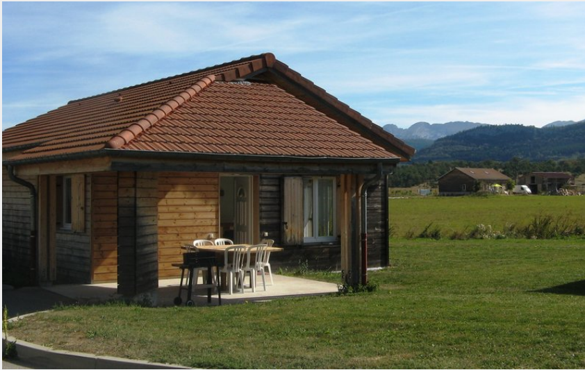
Crédit photo : Un des chalets de la Frache vu de l'extérieur (Marion Ottenheimer)