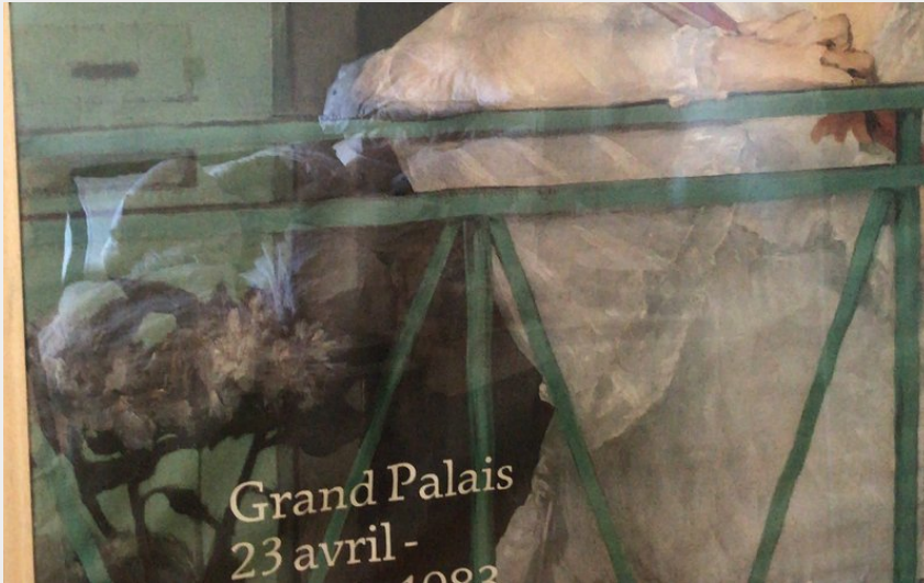
La Maison Verte chambre principale (Rest Mont Aiguille)