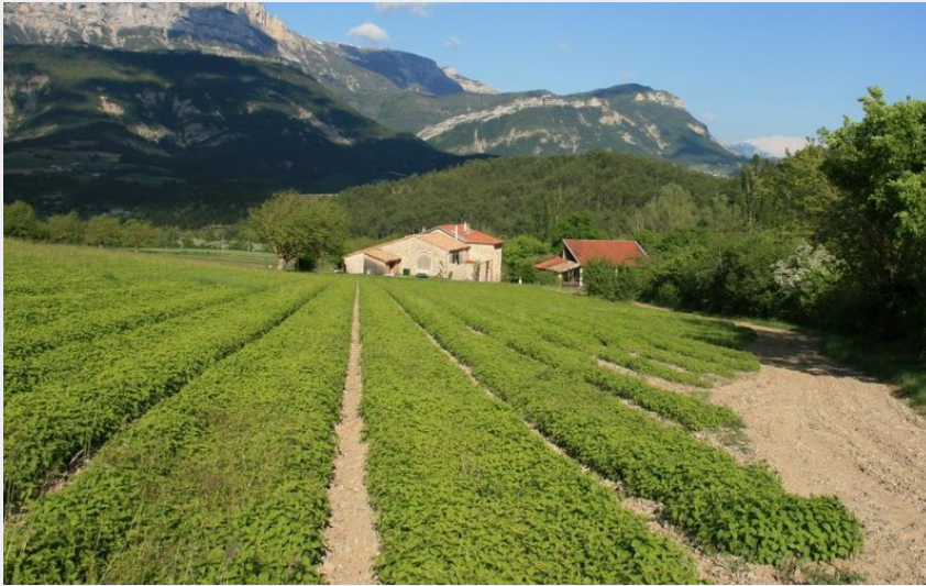
Crédit photo : La Ferme d'ausson avec la montagne de Glandasse (Gîtes de France)