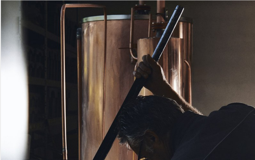
Crédit photo : distillateur alambic (Distillerie Charles Meunier et successeurs_Saint-Quentin-sur-Isère)