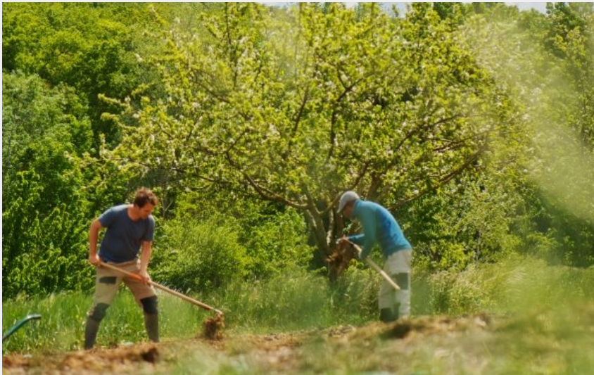
Séjour vacances Printemps paysan