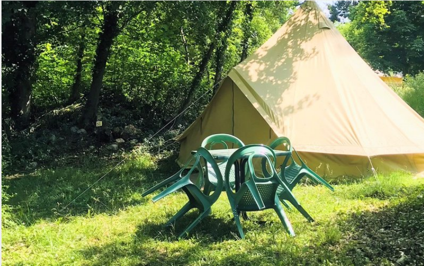
Crédit photo : Tipi au Camping de la Vaugelette_Montclar-sur-Gervanne (La Vaugelette)