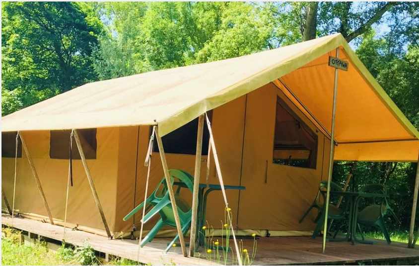
Crédit photo : Tente Lodge Canada au Camping la Vaugelette_Montclar-sur-Gervanne (La Vaugelette)