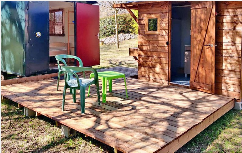
Crédit photo : Roulotte au camping La Vaugelette_Montclar-sur-Gervanne (La Vaugelette)