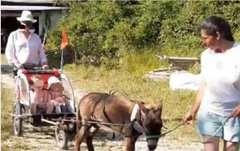
Crédit photo : Balade attelée avec barnabé (Aux sources de Mirmande)